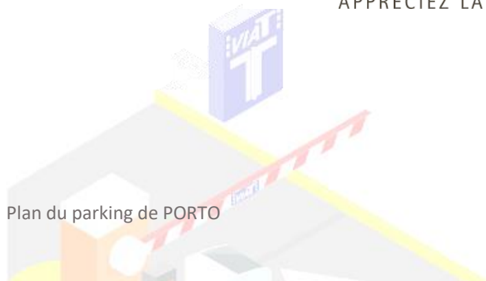
Plan du parking de PORTO